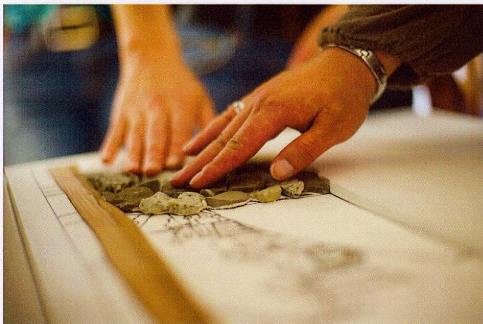
Détail de la maquette du tableau de Raphy Dallèves – empierrement du lavoir.