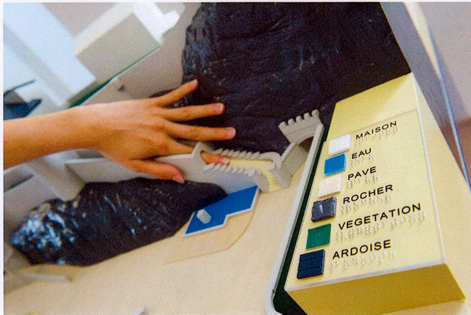
Maquette des deux bâtiments qui abritent le Musées d'art du Valais – code de lecture de la maquette.